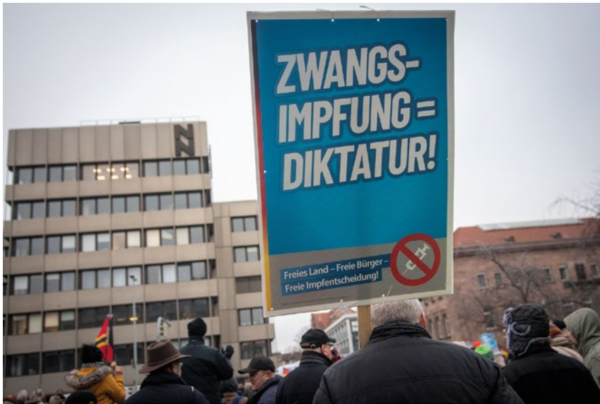
AfD-Politiker nannten die Corona-Pandemie eine „Fake-Pandemie“ und stilisieren sich öffentlich gern zu (vermeintlichen) Freiheitskämpfer*innen wie hier bei einer AfD-Kundgebung in Nürnberg.

Der Lindauer AfD-Politiker Rainer Rothfuß fragte beispielsweise in sozialen Medien raunend, ob man bei den Impfungen gegen Covid-19 „tot geboostert“ würde. Der Münchner AfD-Bundestagsabgeordnete Petr Bystron nannte die Corona-Pandemie nicht nur eine „Fake-Pandemie“ sondern postete auch, Geimpfte hätten anschließend „komische gummiartige Dinger“ im Körper. Die AfD Bayern verbreitete die Panikmache „Viele Geimpfte werden autoimmunkrank“. Bystron bewarb auch eine verschwörungsideologische Dokumentation zum angeblichen „Great Reset“. Dieser Verschwörungserzählung zufolge sind Anpassungen und Modernisierungen der Weltwirtschaft keine Reaktionen auf Klimawandel und Corona-Pandemie. Das World Economic Forum (WEF) und andere hätten diese beiden Krisen stattdessen erfunden und inszeniert, um einen Vorwand für Veränderungen zu haben. Bystron schrieb: „Wow...welch ein Kracher! The big reset ist eine herausragende Doku darüber, worum es bei COVID-19 und dem GREAT RESET der Eliten wirklich geht! Der Film zeigt auf, wer genau die Macher im Hintergrund und ihre Pläne der Agenda 2030/des GREAT RESET sind, welches Netzwerk sie haben und