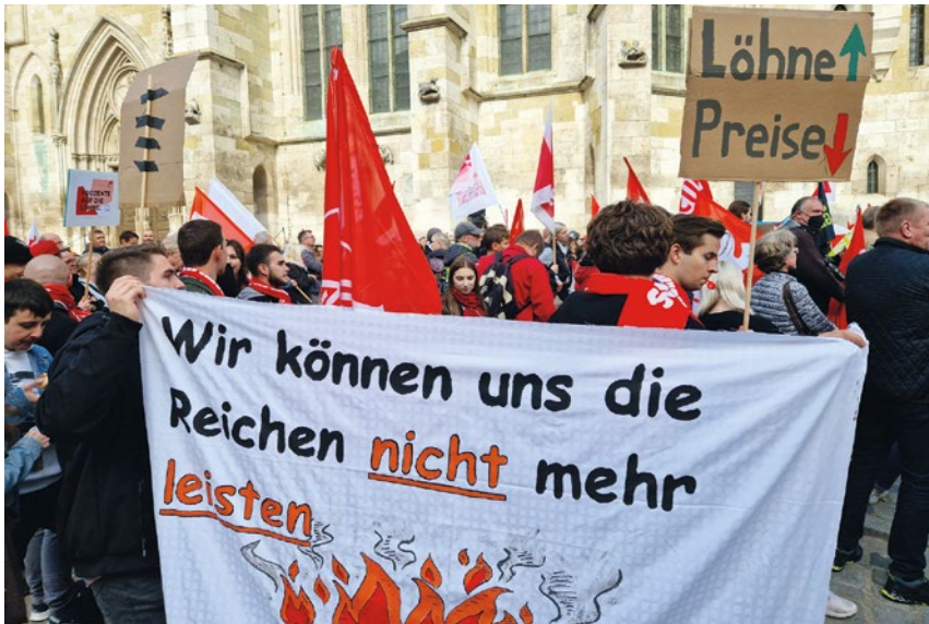
Der DGB steht für faire Löhne und ein gerechtes Steuermodell. Die AfD hingegen fordert Steuergeschenke für Reiche, auf Kosten der Allgemeinheit.

Einigen AfD-Spitzenpolitiker*innen gehen die Forderungen ihrer Partei noch nicht weit genug, sie propagieren die direkte steuerliche Entlastung von Unternehmen und Spitzenverdiener*innen. „Der Spitzensteuersatz ist hoch genug“, meint etwa die Bundestagsabgeordnete Beatrix von Storch. Auch dies widerspricht den Forderungen der Gewerkschaften. In den steuerpolitischen Eckpunkten des DGB heißt es dazu, dass es „im Interesse einer leistungsgerechten Besteuerung einerseits darauf an[kommt], den Spitzensteuersatz zu erhöhen. Ebenso wichtig ist es andererseits auch, dass ein erhöhter Spitzensteuersatz erst bei einem deutlich höheren Einkommen ansetzt.“