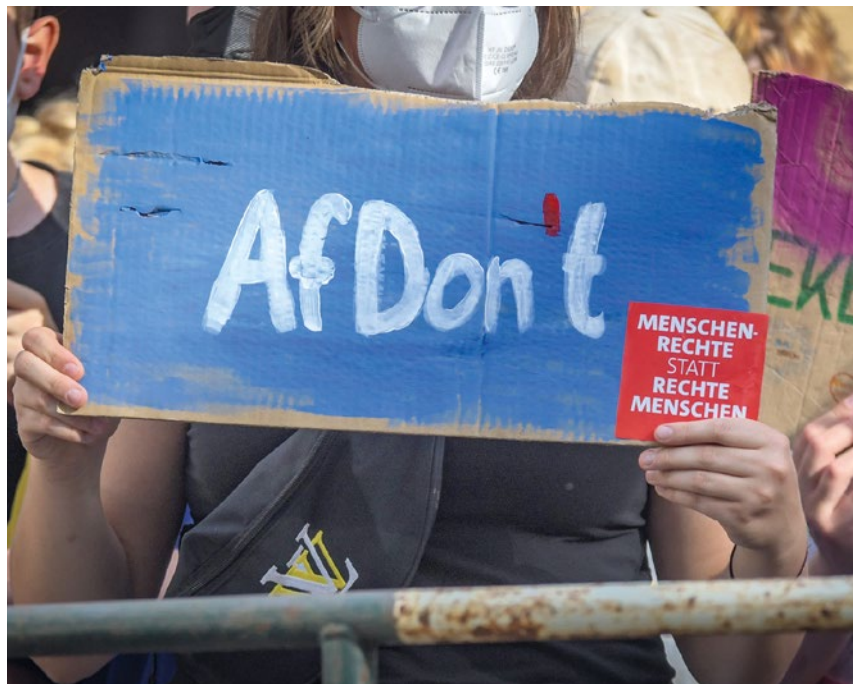
Demonstrant*innen auf einem Protest gegen die AfD in Memmingen.

Auch in das bayerische Landtagswahlprogramm und das Grundsatzprogramm der AfD hat die Forderung nach der Abschaffung der Erbschaftsteuer Eingang gefunden. Dort heißt es: „Der Verwaltungsaufwand für ihre Erhebung ist überproportional hoch als auch ihr Ertrag für die Staatseinnahmen nur marginal.“ Tatsächlich werden nach Schätzung jedes Jahr 400 Milliarden Euro vererbt – das ist mehr als der deutsche Bundeshaushalt umfasst. Davon entfällt etwa ein Drittel auf die oberen zwei Prozent der Hinterlassenschaften. Allein im Jahr 2021 sind der Staatskasse durch die Erhebung der Erbschaftsteuer 9,8 Milliarden Euro zugeflossen. Statt einer