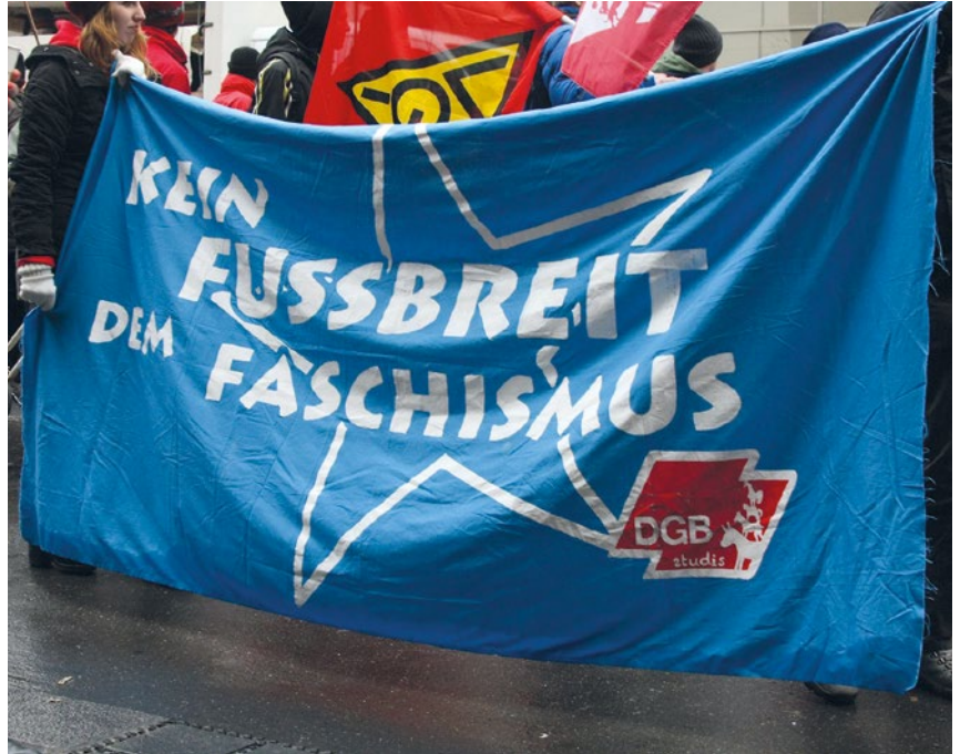
Wie hier in Bremen treten der DGB und seine Mitgliedsgewerkschaften jeder Form von Fremdenhass entschieden entgegen.

Auch in Bayern demonstriert die AfD vor Gewerkschaftshäusern. So 2017 in München, als es ihr trotz einer breit angelegten Schmutzkampagne nicht gelang, den jährlichen Antifaschistischen Kongress der Gewerkschaftsjugend in Bayern zu verhindern. Auf ihrer Demonstration vor dem Gewerkschaftshaus, an der auch PEGIDA-Aktivist*innen und andere Rechtsextremist*innen teilnahmen, wettete die AfD Bayern gegen die „Arbeiterverräter des DGB“ und die „Gewerkschaftsbonzen“.