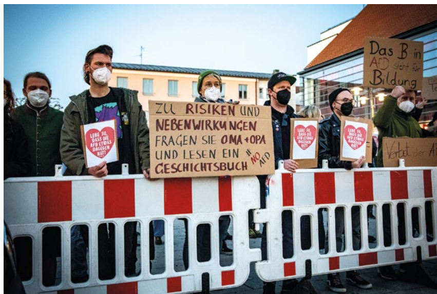
Auf einer Demo in Deggendorf protestieren Demonstrant*innen gegen die AfD.

oder Geert Wilders in den Niederlanden. In Deutschland jubelten CSU und AfD gleichermaßen. Alexander Dobrindt sagte über den ungarischen Ministerpräsidenten, der im Wahlkampf eine massive, antisemitische Kampagne gegen den amerikanischen Milliardär George Soros initiiert hatte: „Ich gratuliere unserem Freund Viktor Orbán zu seinem starken Wahlerfolg“. Dessen Stimmengewinn sei „eine klare Bestätigung von Orbáns bürgerlich-konservativem Kurs für ein erfolgreiches Ungarn, eine Begrenzung der Zuwanderung und ein sicheres Europa.“ Die AfD-Bundestagsfraktion titelte: „Ein guter Tag für Europa!“