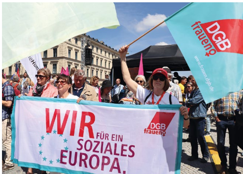
Der DGB Bayern und seine Mitgliedsgewerkschaften stehen für ein soziales Europa – ganz im Gegensatz zur AfD.

In den Bundestagswahlkampf 2021 zog die AfD mit der Forderung nach dem Austritt Deutschlands aus der EU und plädierte für die Auflösung des Schengen-Abkommens, das Reisefreiheit und freien Warenverkehr in Europa regelt.