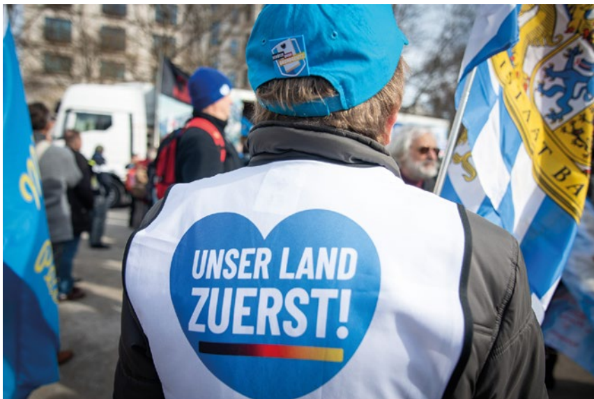
Die AfD bei einer ihrer Kundgebungen: Mit dem Slogan „Unser Land zuerst“ geht eine Politik der Ausgrenzung und Diskriminierung einher.

seinem Artikel „Die Schutzschild-Strategie“, den er auf dem anonym betriebenen, rassistischen Webportal „PI-News“ veröffentlichte: