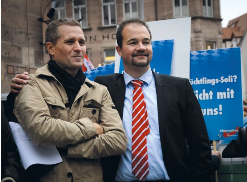
Petr Bystron (l.), bayerischer AfD-Bundestagsabgeordneter, und Martin Sichert, ehemaliger Landesvorsitzender der AfD Bayern, bei einer AfD-Kundgebung in Nürnberg

macht die Partei Stimmung. Die AfD Bayern verbreitete während der Corona-Pandemie beispielsweise das Sharepic „Kein Urlaub wegen Corona, aber Flüchtlinge werden eingeflogen!“. Im Landtag verwendet die AfD seit Jahren konsequent den einst aus der Szene der neofaschistischen „Identitären“ stammenden Begriff der „Remigration“, um Massenabschiebungen zu fordern. Und auch die AfD München plakatierte zu Beginn des Landtagswahlkampfes 2023: „Es reicht! Remigration statt Massenmigration!“. Der AfD-„Spitzenkandidat“ Martin Böhm begann den Wahlkampf unter anderem mit der Parole „Festung Deutschland – Grenzen schließen, Sicherheit garantieren“.