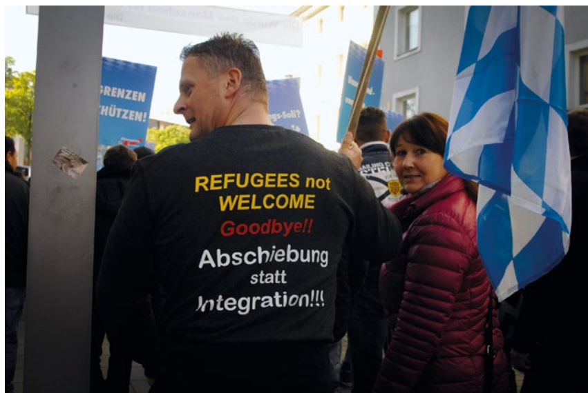
Auch bei der bayerischen AfD stehen Kampagnen gegen Zuwanderung im Vordergrund.

Längst ist ein radikales Auftreten innerhalb der AfD hegemonial geworden. Nur noch selten wird aus Rücksicht auf eine (bereits bestehende oder drohende) Beobachtung durch den Verfassungsschutz zurückhaltender formuliert. Stattdessen wird zunehmend offen ein Systemumsturz durch zunächst „Kulturkampf“, Rebellion und Fundamentalopposition propagiert und dazu die Vernetzung mit dem „Vorfeld“, d. h. anderen extrem rechten oder neofaschistischen Akteur*innen gesucht. Auf Antrag bayerischer AfD-Funktionär*innen hat der letzte AfD-Bundesparteitag die neonazistische durchgesetzte Betriebsliste „Gewerkschaft Zentrum“ (früher: „Zentrum Automobil“) von der sog. „Unvereinbarkeitsliste“ der Partei gestrichen. In der Begründung hieß es: „Jede alternative Gewerkschaft, die nicht zum DGB gehört, sollte unterstützt werden.“ Als