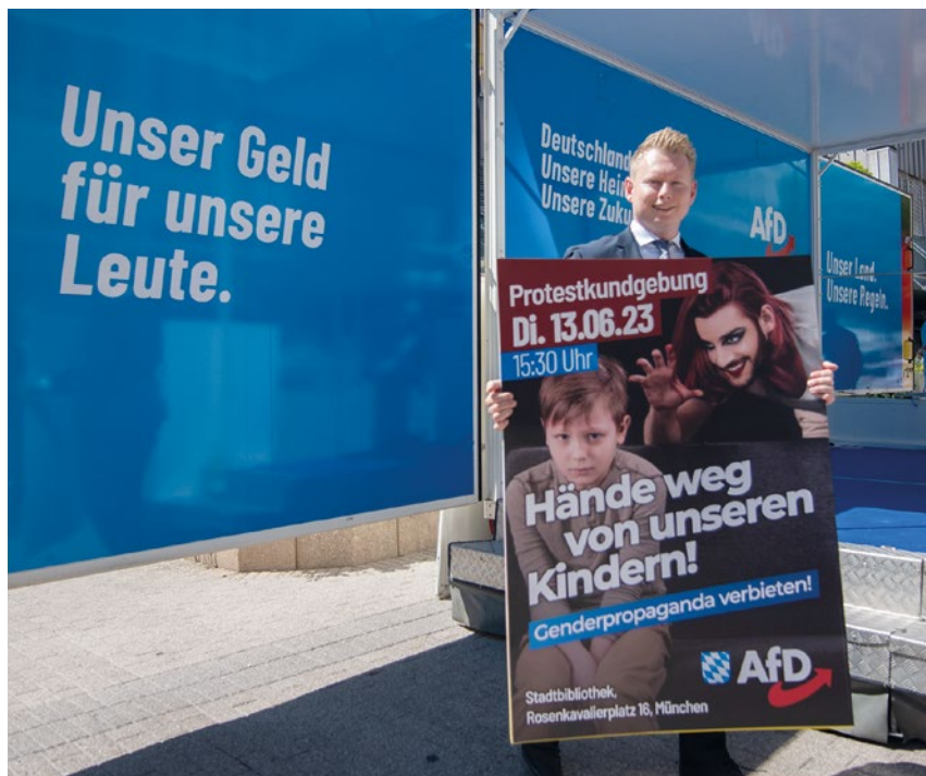
Homophobie und der Kampf gegen sexuelle Vielfalt gehören zum Markenkern der AfD. Bei einer Lesung von Drag-Queens in München verunglimpft die AfD queere Menschen.

Neben dem eigenen Programmpunkt ›Familien und Kinder‹ spielen diese Vorstellungen in der Arbeitsmarkt- und der Sozialpolitik eine wesentliche Rolle. Aber auch, wenn es um Bildung, Steuern, die Entwicklung des ländlichen Raumes, die Wohnungsbau- oder die Integrationspolitik geht, fehlt die Nennung von Kindern oder ›der Familie‹ nicht. Der Partei gelingt es so, zugleich konservative und neoliberale Positionen zu vereinen. Den Rückzug des Staates aus weiten Teilen der sozialen Sicherungssysteme kombiniert die Partei mit dem Plädoyer, die traditionelle Familie zu stärken, die künftig die soziale Verantwortung im Alter, bei Krankheit, Arbeitslosigkeit oder Pflege übernehmen soll. Wer nicht auf diese familiäre Hilfe bauen kann, steht dann in sozialen Notlagen ohne Unterstützung da.