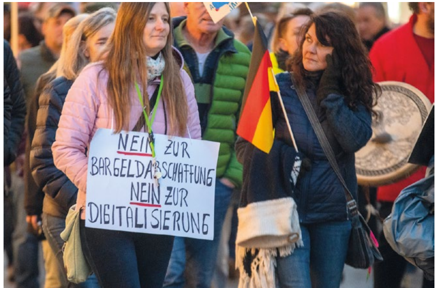
Im Zentrum der Bildungspolitik der AfD steht das Leistungsprinzip und die Ausgrenzung von sozial Benachteiligten.